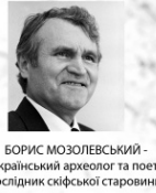
БОРИС МОЗОЛЕВСЬКИЙ - український археолог та поет, дослідник скіфської старовини.