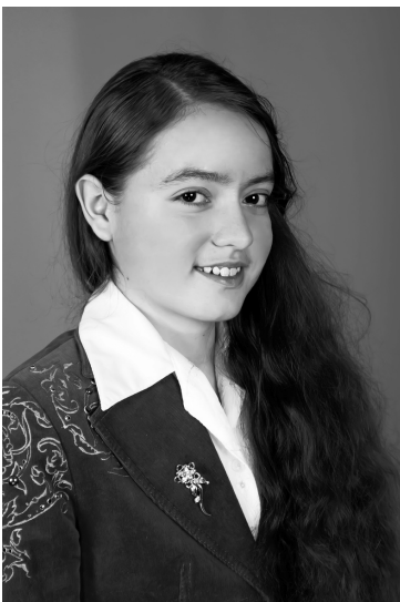
(Закінчення. Початок на 1 стор.)