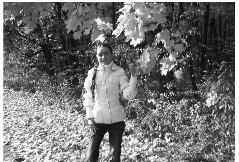
ОЛЕКСАНДРА НАВЧАЛАСЬ І ПЕРЕМАГАЛА

Кожен з нас пам'ятає світ свого дитинства з яскравими смарагдами трав, велетнями-деревами, птахами жар-птицями. Звісно ж, обдарована дівчинка сприймала навколишність особливо гостро. Це й приваблювало читачів до її свіжого, юного слова, в якому вона зростала і різнобічно, і понадмарно, ніби компенсуючи творчістю, уявою, фантазією те, чого їй не вистачало в житті, намагаючись обійти своїм казковим фентезі і поетичним злетом підступи захворювання, здолати його високою духовністю. Її працездатність не знала меж, ніби відкривалися якісь особливі резерви можливостей, і духовне переважало над фізичним. Гарна вродою, ясна усмішкою, горда і незалежна в поведінці, добра і співчутлива, весела і товариська, серйозна і цілеспрямована, Олександра, як зоря, засяяла на небосхилі української літератури. Прихильна до всіх націй, зацікавлена кожною особистістю, вона і своєю поведінкою, і творчістю вабила до себе і дітей, і дорослих. До останніх любила звертатися теж на ім'я, як до рівних. А її творчість набирала все більшої ваги, краси і мудрості. Не любила радитись ні з ким, завжди покладалась на себе, ніби їй було відкрито щось невідоме для інших і вона спішила повідати про це у своїх творах.