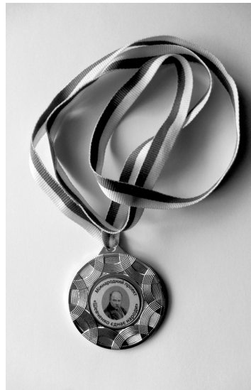
На світлинах: грамота Гран-прі і медаль.

лодимир Якович, цього року творчість Олександри БУРБЕЛО надихнула Міжнародну лігу «Матері і сестри – молоді України» за сприяння Київського університету імені Тараса ШЕВЧЕНКА, Національного музею Тараса ШЕВЧЕНКА, Національної Ради жінок України, товариства «Знання» України посмертно нагородити юну поетесу Гран-прі «Пам'ять». Відповідно до написаного в тексті грамоти Гран-прі, Олександра БУРБЕЛО нагороджується «За майстерне втілення шевченківського духу у власній творчості і пропагування ідей Великого Кобзаря».