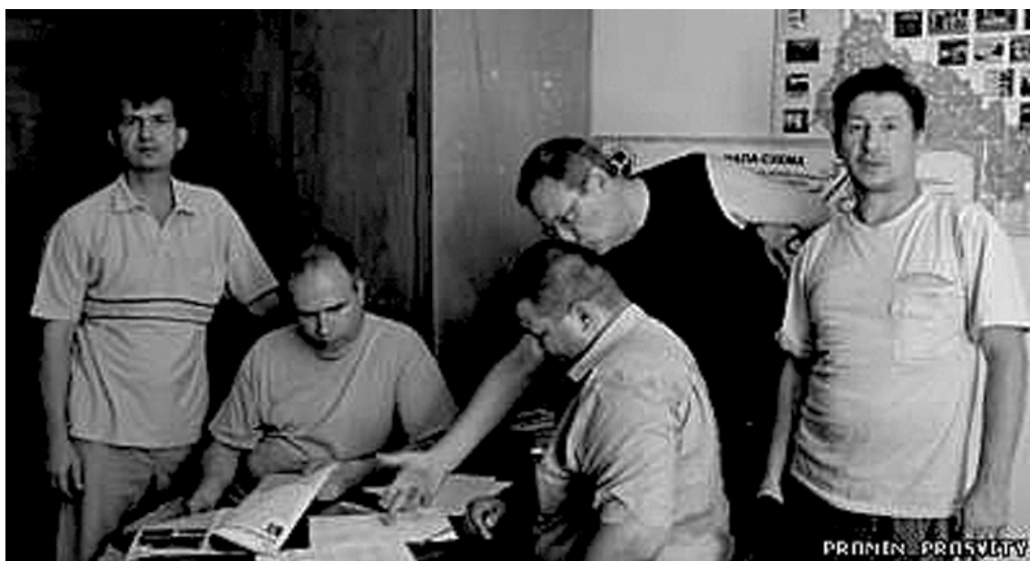
Читайте на 3-й стор.