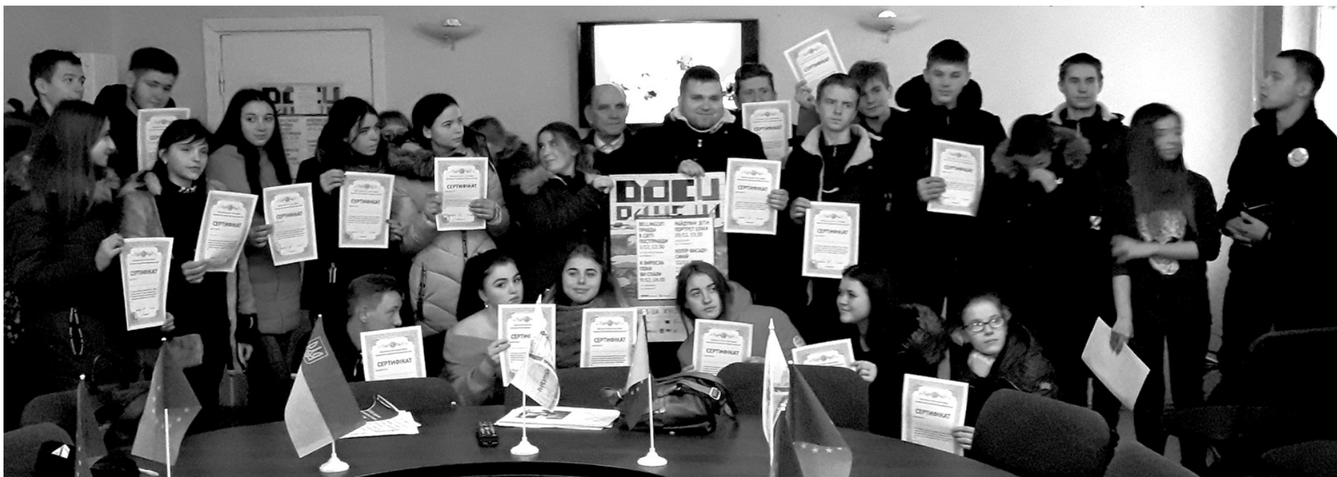
(Читайте на 3-й стор.)