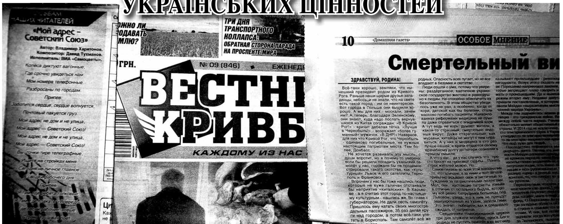
(Читайте на 3-й стор.)