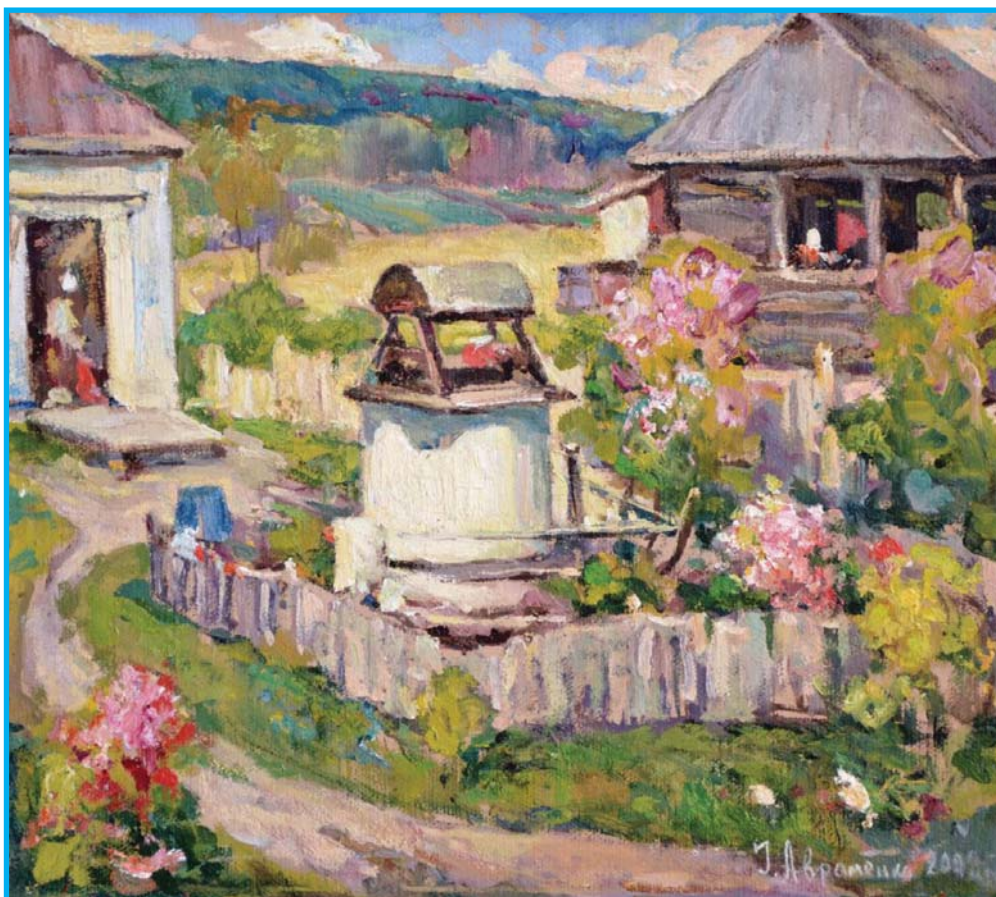
фото містяться за посиланням: https://sverediuk.com.ua/hudozhnyk-avramenko-ivan-gavrylovych/

Промінь Просвіти Є Видавець і засновник – ГО «Криворізьке міське правозахисне товариство». Свідоцтво про державну реєстрацію № 2162 – 900 р, видане 23.02.2017 р. Передплатний індекс: 60093 Адреса редакції: 50099, м. Кривий Ріг, вул. Церковна, буд. 3, к. 210. e-mail: kmpzt@ukr.net. Тел. 067-568-39-73