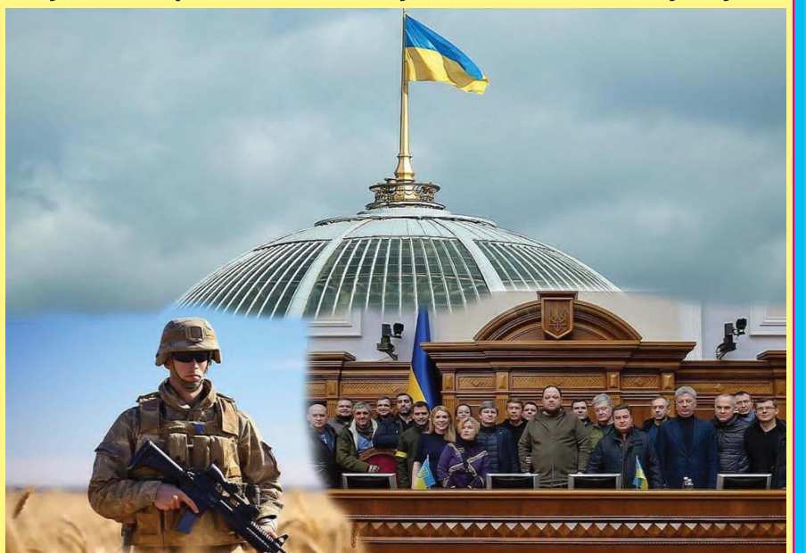
Закінчення на 7-й сторінці

республіці в умовах правового режиму воєнного стану саме Верховна Рада України повинна приймати рішення, які можуть посилити чинник моральності в керівництві державою і, зокрема, Воєнною організацією і сектором безпеки (зараз це Сили оборони України). Які рішення можуть бути?